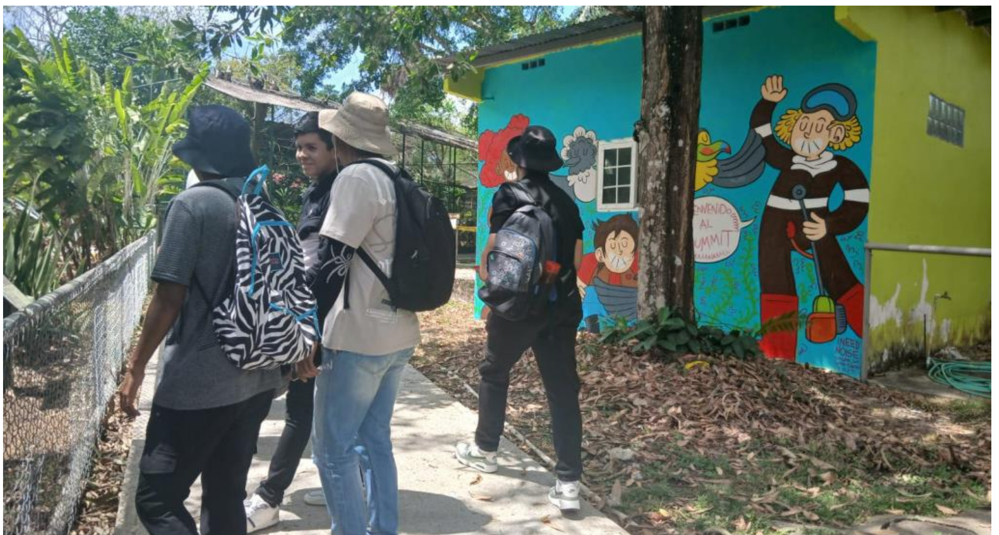
Visita la Parque Metropolitano Summit.