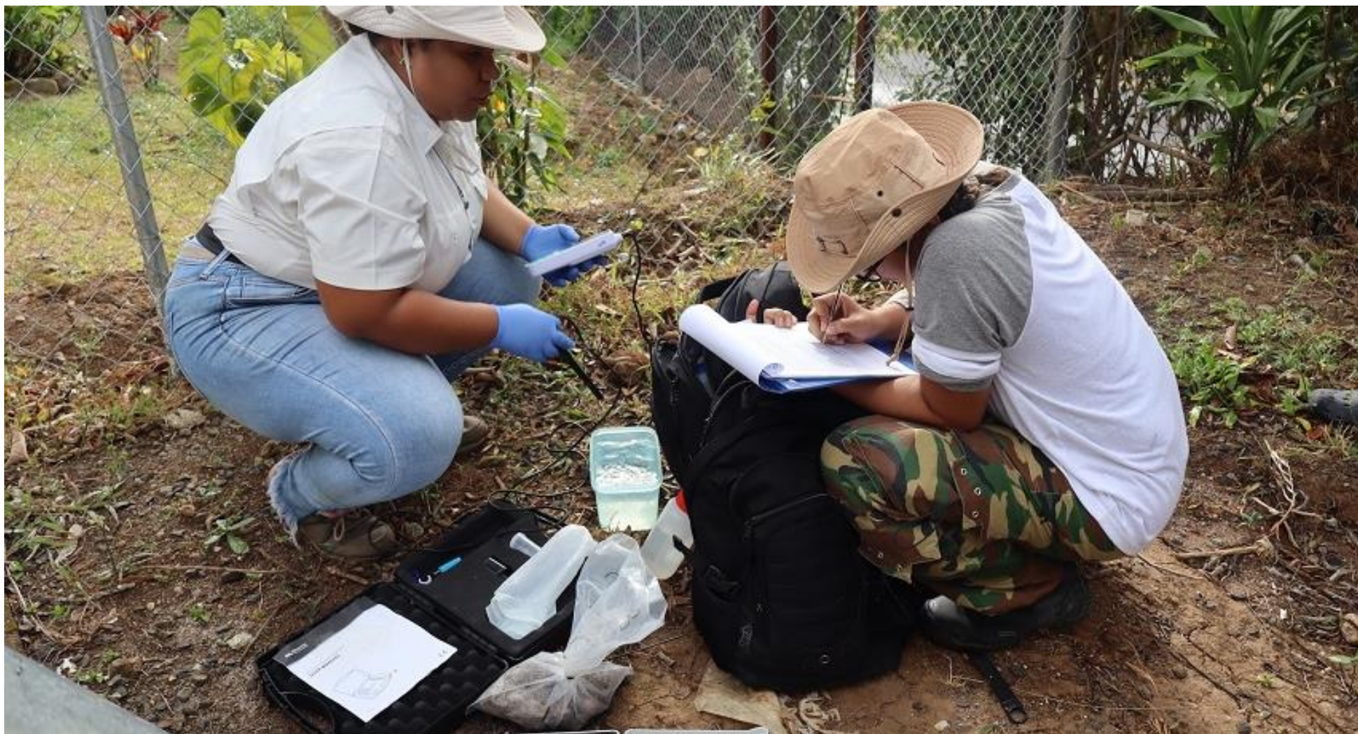
Medición de parámetro en muestra de agua.