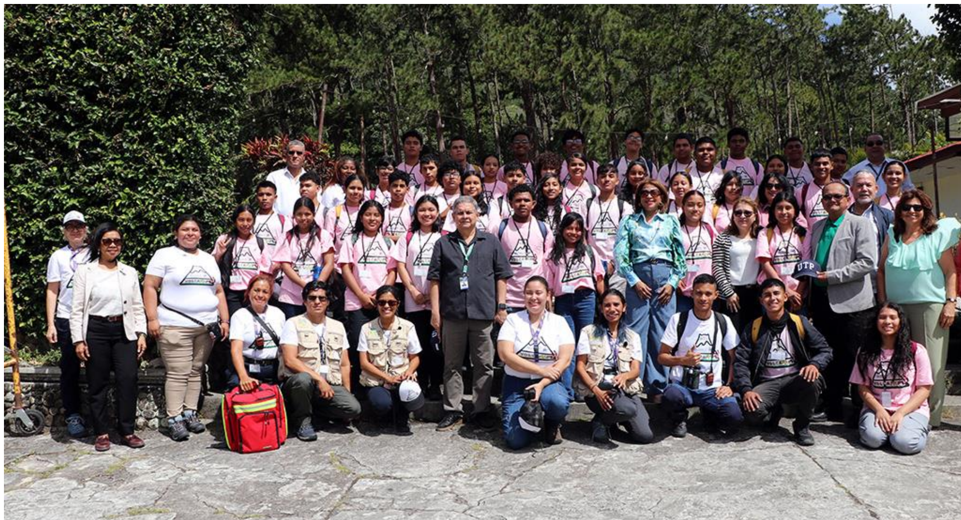
Autoridades de la UTP con los estudiantes e instructores del campamento.