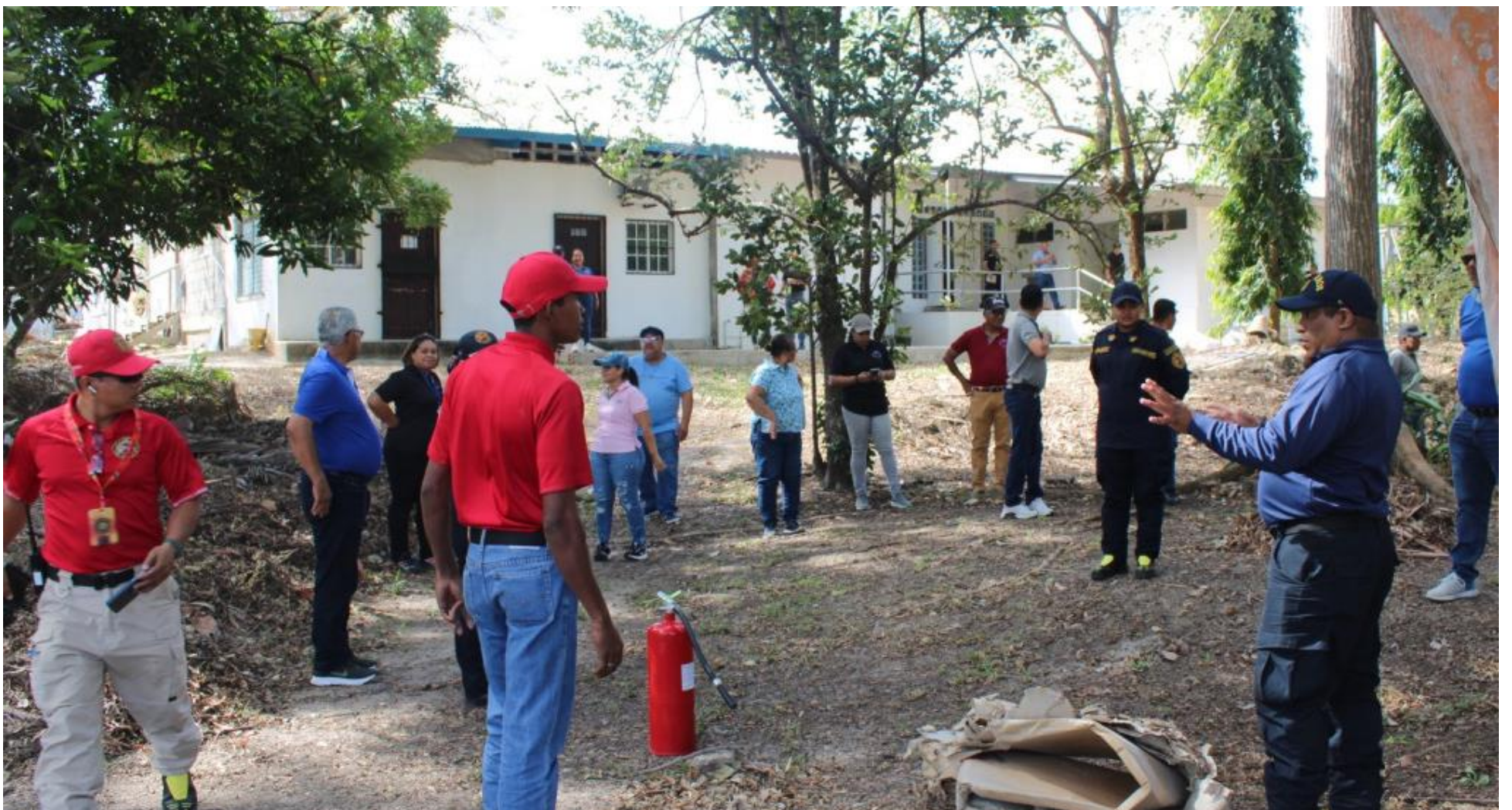
Uso de extintores.