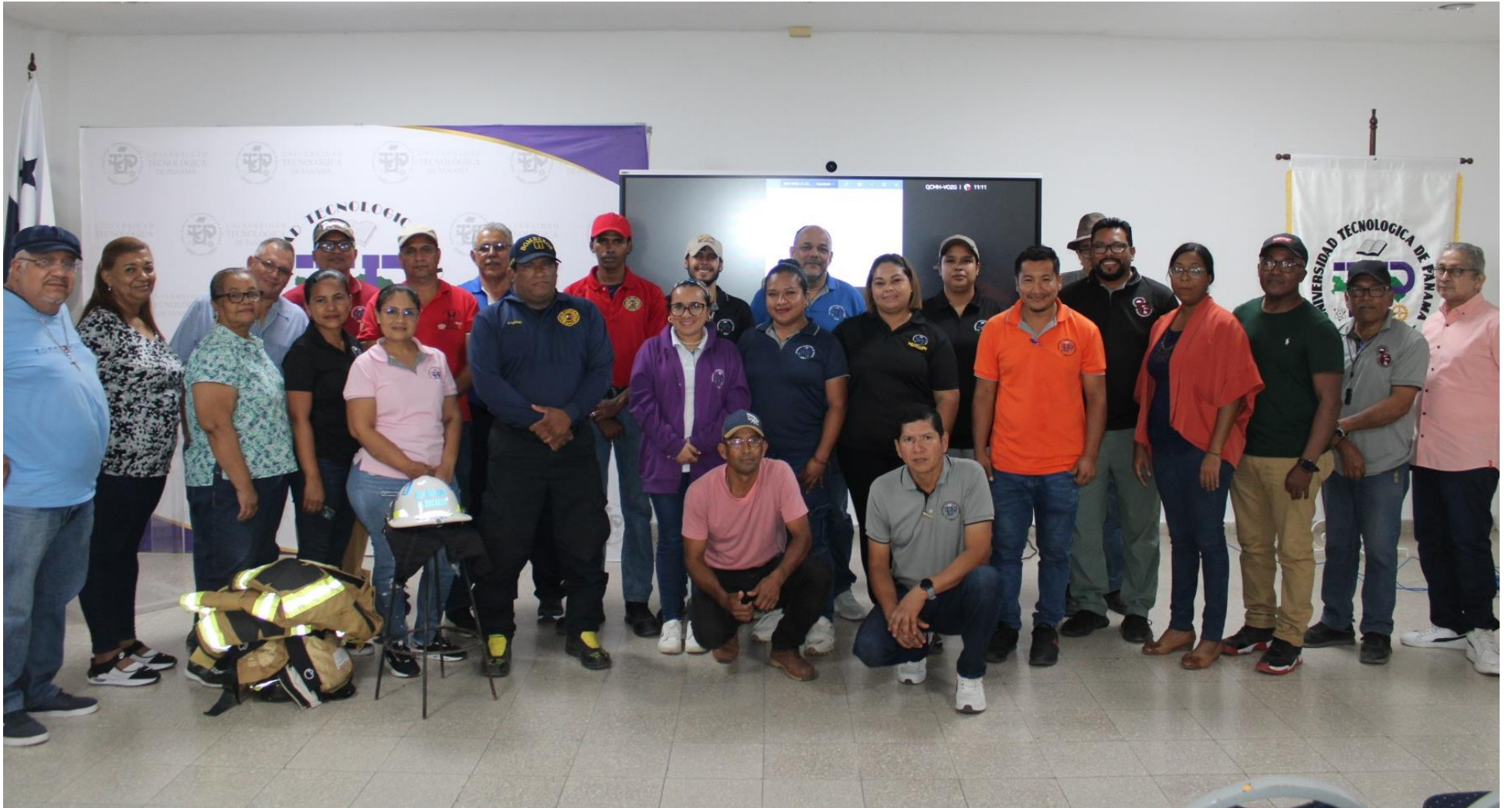
Inician los cursos de receso académico.