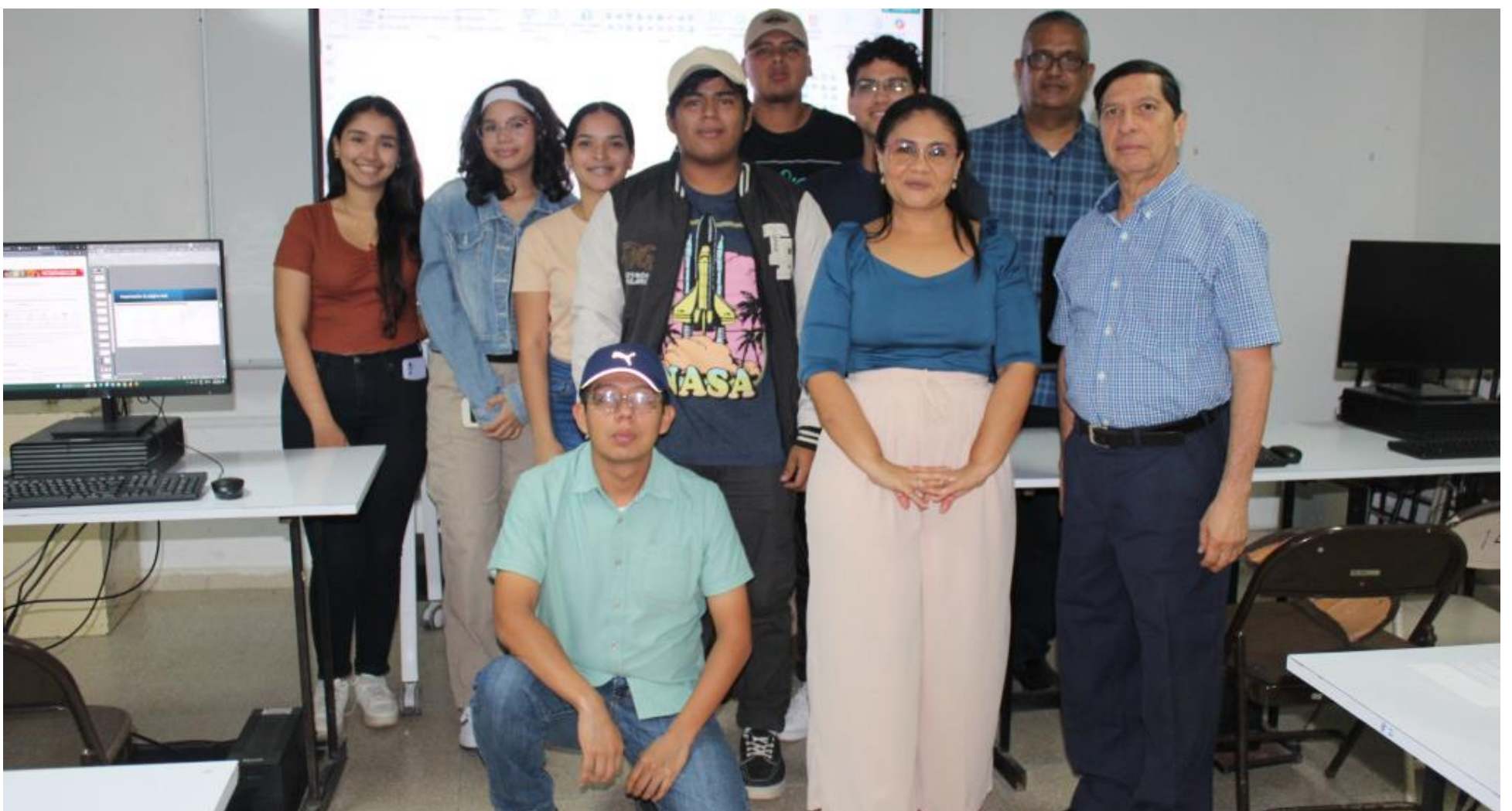
Seminario de PowerBI.