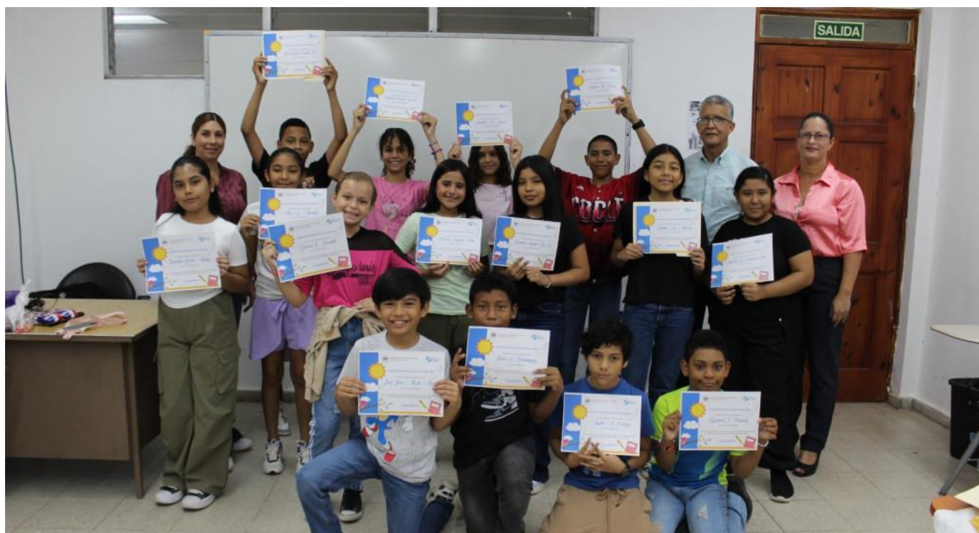
Foto grupal con los estudiantes.