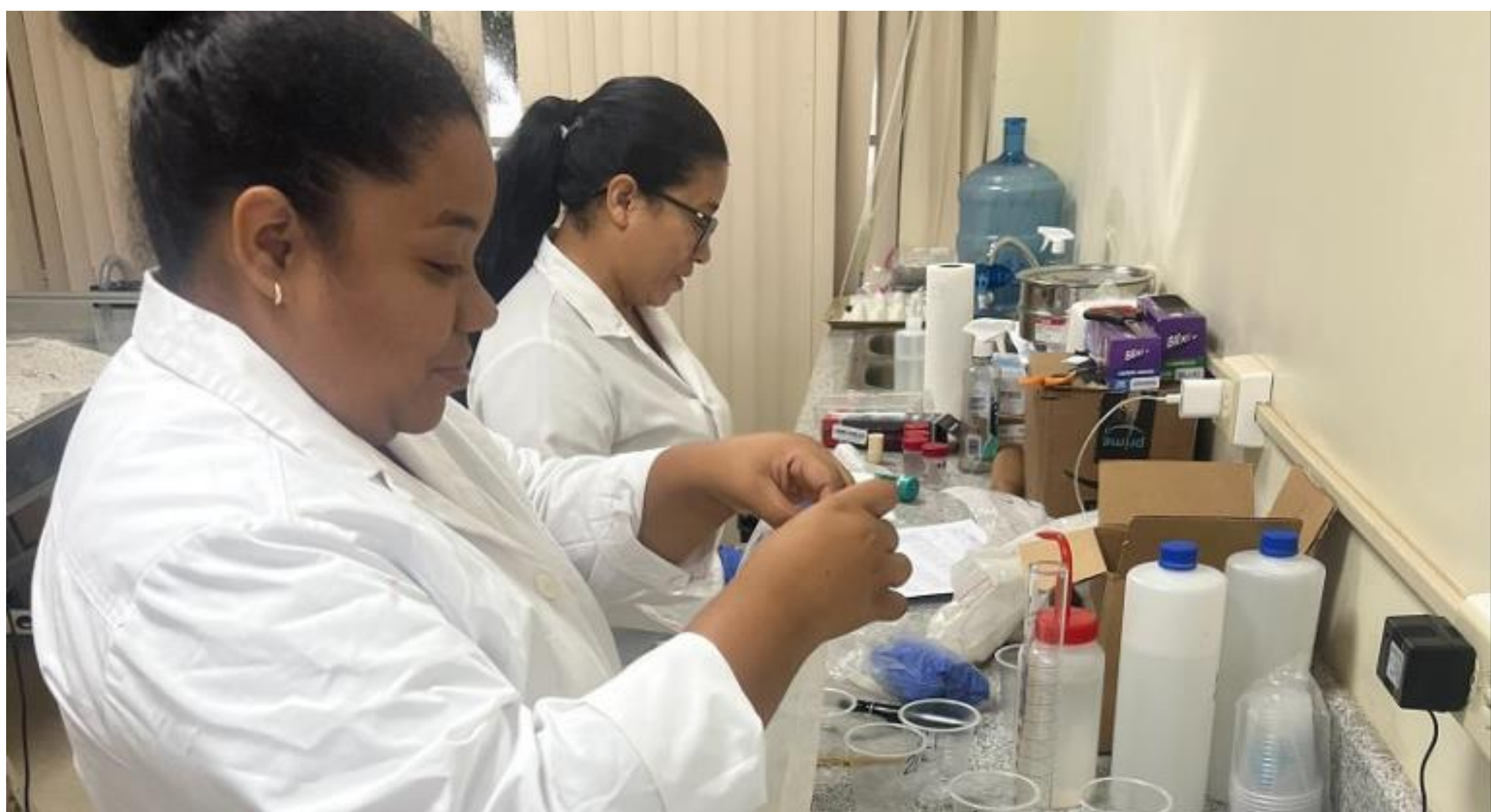
Trabajo de laboratorio Medición de pH en suelo.