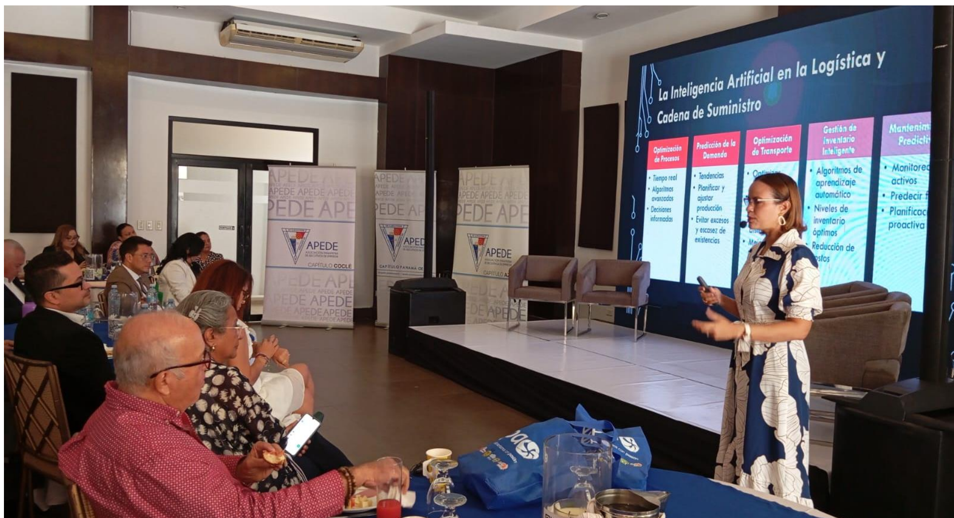
Ciclos de conferencias en el Hotel Coclé.