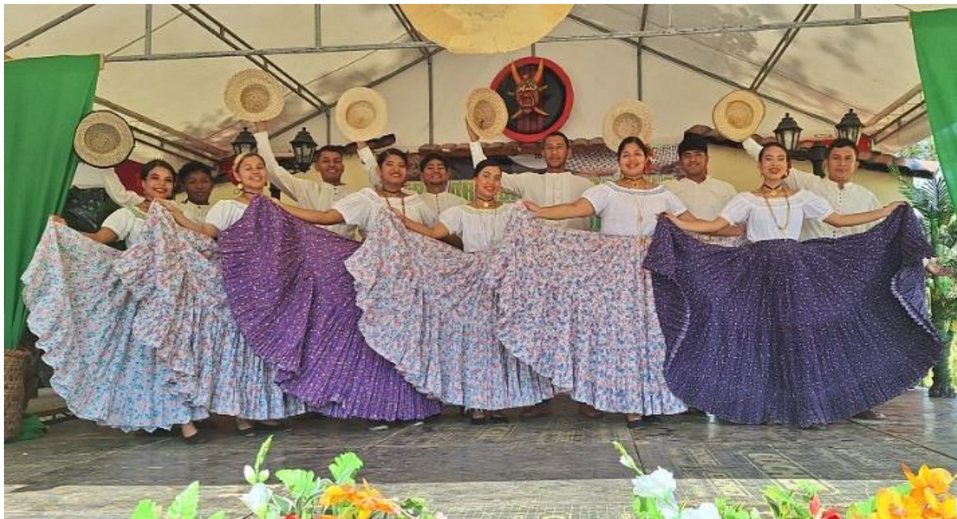
Conjunto Típico Alma Universitaria.