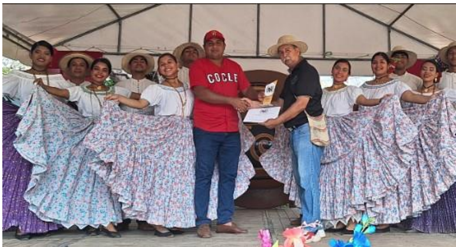
Entrega de certificado de participación.