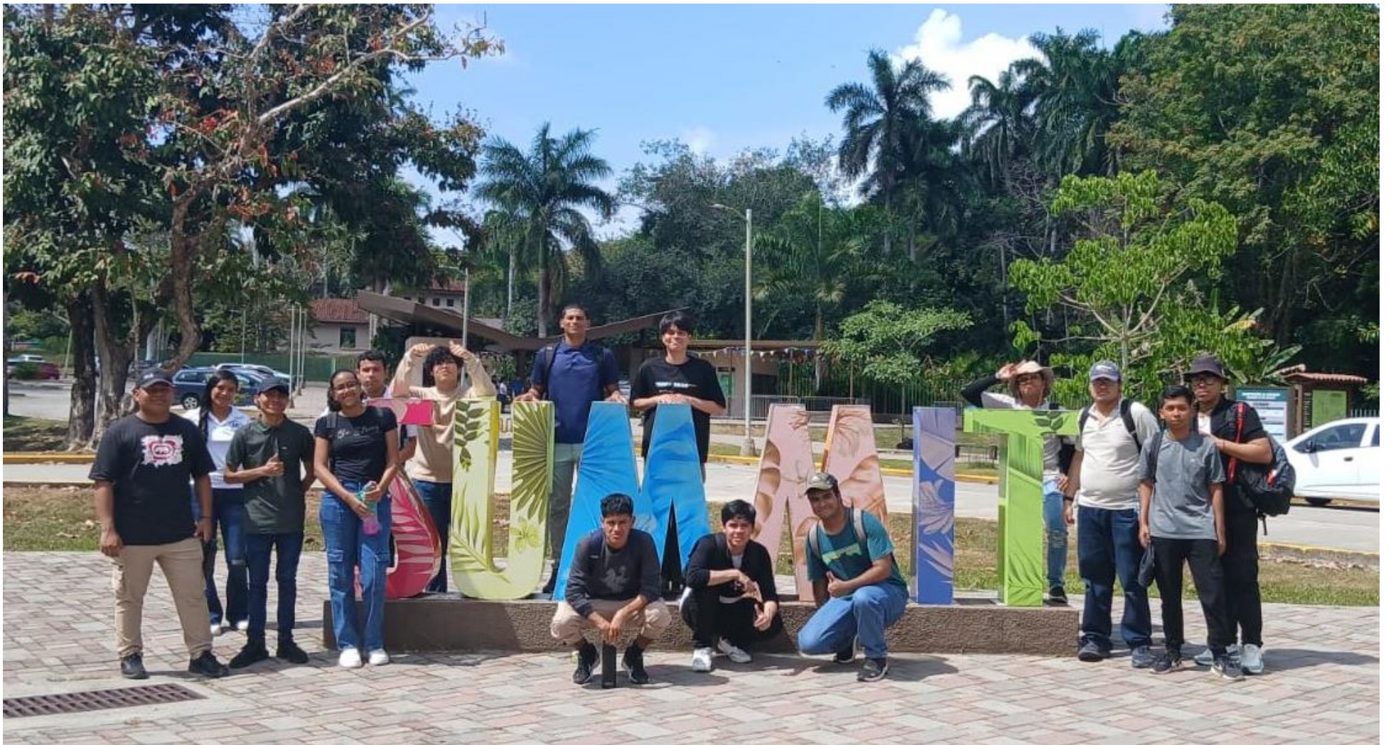
Estudiantes de la FISC que participaron de la gira.