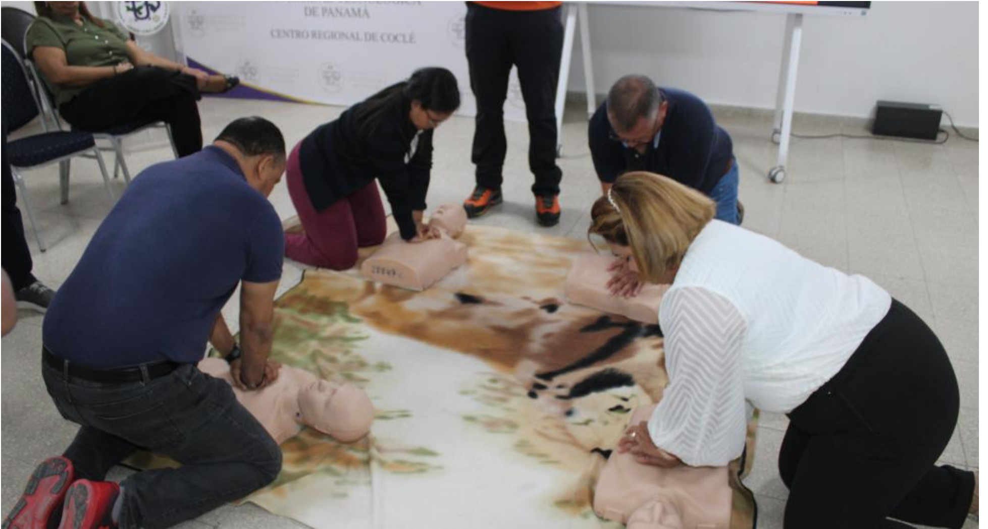
Estrategias para Emergencias y Desalojos